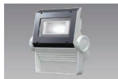
LED投光器 角形 電源一体型 DTE05H95W/NP-4 定格消費電力:33W