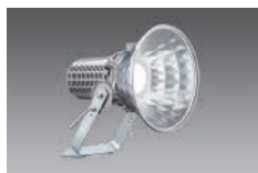
LED投光器 丸形 電源別置型 DTC30404/NPT-4 定格消費電力:207W