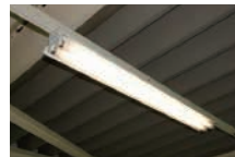
蛍光灯器具 FLR40W×2灯 消費電力 85W/台