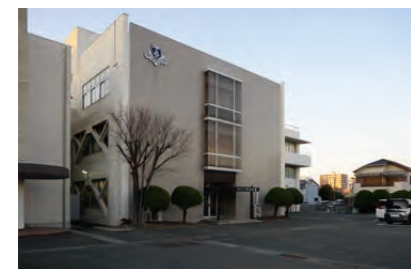
株式会社 河合楽器製作所 静岡県浜松市中区寺島町200番地