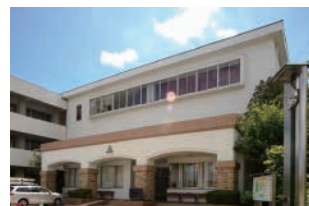
学校法人 八女学院 福岡県八女市大字本村425