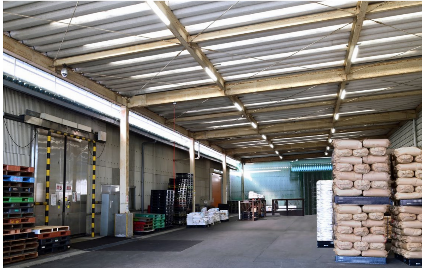
● LED一体型ベース照明 Nuシリーズ (防雨防湿形)

既に生産を終了した水銀ランプや、2027年に生産を終了する蛍光灯を使用している照明器具からLED照明器具への交換を実施しました。LED化により高所のランプ交換作業の手間が掛からなくなり工数削減が図れました。器具の汚れやランプ寿命により低下していた明るさもLED照明器具への交換により回復し、消費電力も6割以上削減できました。