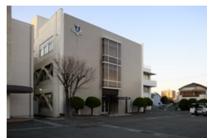
株式会社河合楽器製作所 静岡県浜松市中区寺島町200番地