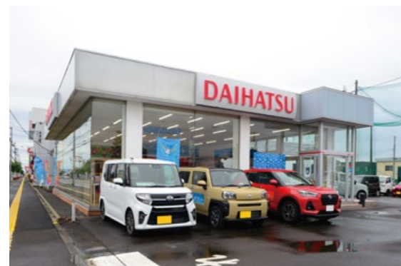
ダイハツ北海道販売株式会社 江別店 北海道江別市幸町32