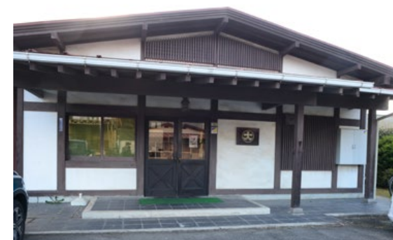
株式会社大之木ダイモ 安芸津工場 広島県東広島市安芸津町木谷1218-20