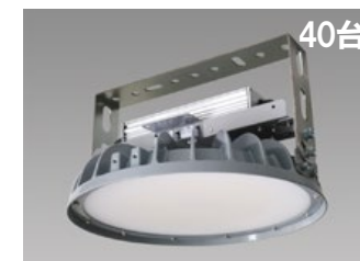
40台 高天井用LED照明器具 DRGE20H24G/N-PJX8 平均消費電力: 112W