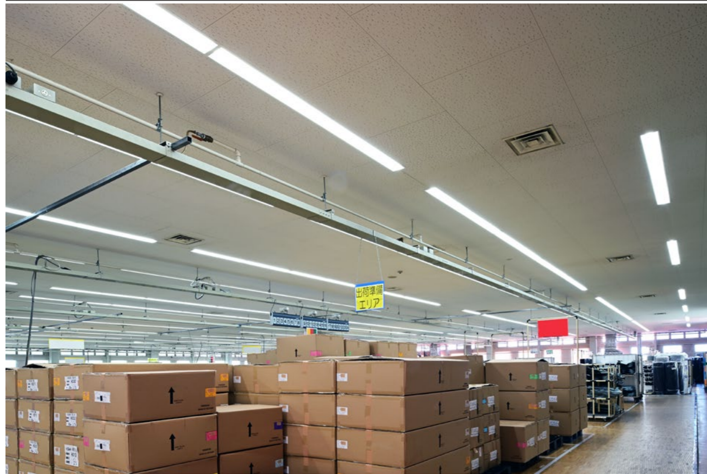
■ 工場 LED一体型ベース照明 Nuシリーズ110形 埋込下面開放形

精密作業に必要な明るさを緻密な照明設計で確保し、稼働率が高く、生産性の良い工場をそのままLED化。