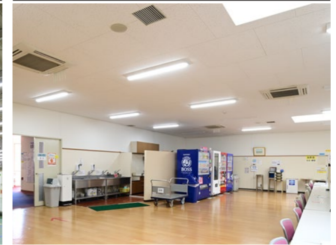
■ 工場 LED一体型ベース照明 Nuシリーズ