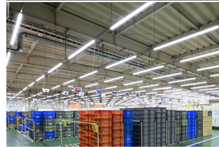
■ 工場 LED一体型ベース照明 Nuシリーズ110形トラフ形

LEDダウンライト クラス150 MRB15028W3/N-8 定格消費電力:12.0W