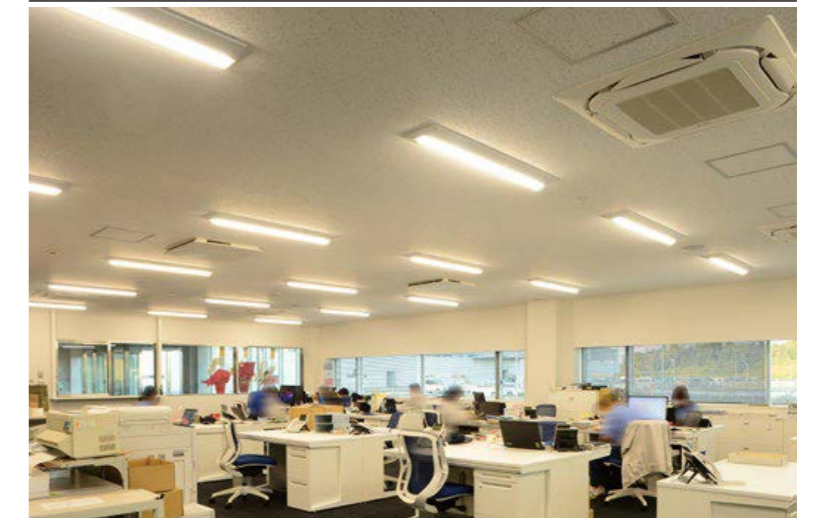
■ 会議室 LED一体型ベース照明 Nuシリーズ