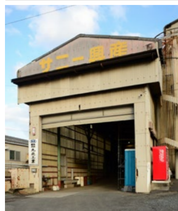
株式会社九北工業 福岡県遠賀郡遠賀町大字鬼津1668-3