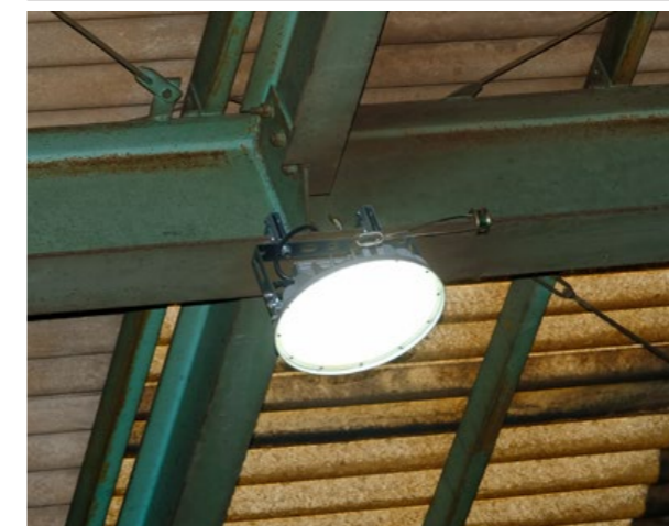
■ 高天井用LED照明器具