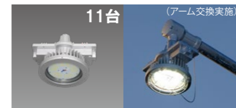
11台 (アーム交換実施) 防爆形LED照明器具 高天井形 取替需要形 DRRE13H01(TB)S/N-PJ8(ガード付) 平均消費電力:92W N4954 EXポールホルダ