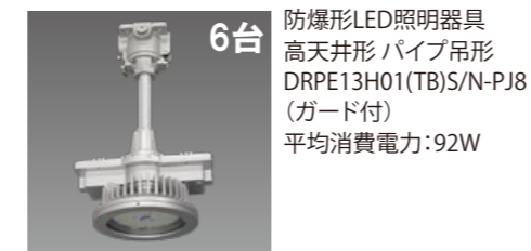
6台 防爆形LED照明器具 高天井形 パイプ吊形 DRPE13H01(TB)S/N-PJ8 (ガード付) 平均消費電力:92W