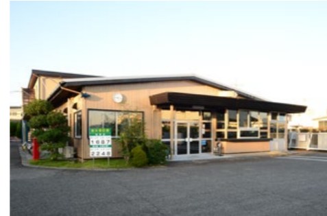
四日市合成株式会社 六呂見工場 三重県四日市市六呂見710