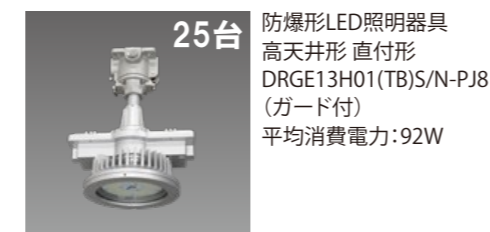
25台 防爆形LED照明器具 高天井形 直付形 DRGE13H01(TB)S/N-PJ8 (ガード付) 平均消費電力:92W