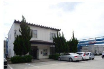
某化学工場 滋賀県蒲生郡