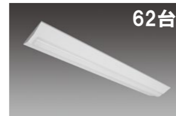
LED一体型ベース照明 Nuシリーズ 40形 逆富士形 MVB4103/52N4-N8 定格消費電力:31.5W