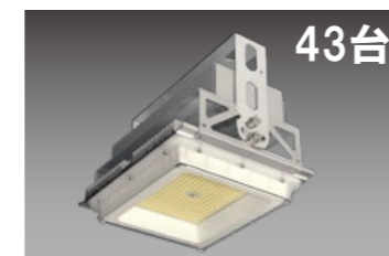
高天井用LED照明器具 水銀ランプ400形相当 広角タイプ DRGE17H41S/N-P8 定格消費電力:86.0W