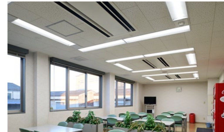
■ オフィス LED一体型ベース照明 Nuシリーズ