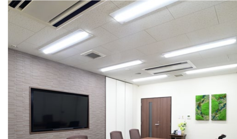
■ 事務棟 LED一体型ベース照明 Nuシリーズ 埋込開放形 + LEDダウンライト