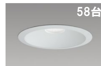
LEDダウンライト φ150mm クラス100 MRB10028W3/N-8 定格消費電力:6.9W