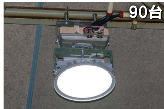
高天井用LED照明器具 電源一体型 メタルハライドランプ400形相当 DRGE25H24G/N-PJX8 平均消費電力: 141W