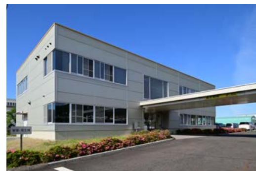
住友精密工業株式会社 滋賀工場 滋賀県草津市岡本町1000-15