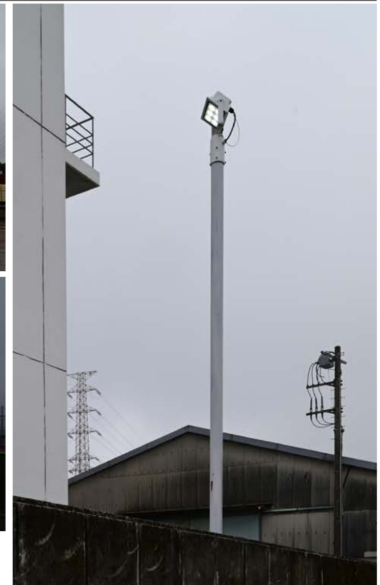
LED照明器具導入による消費電力削減率