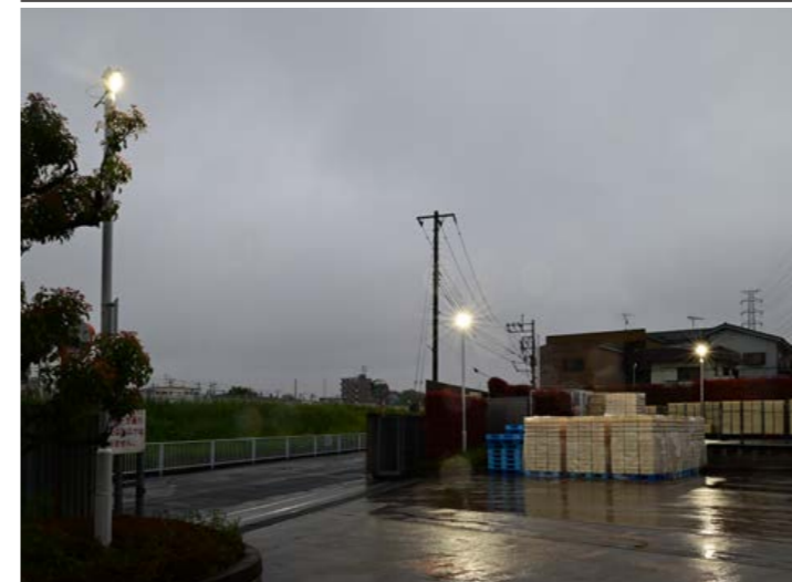
■ LED投光器 LED街路灯