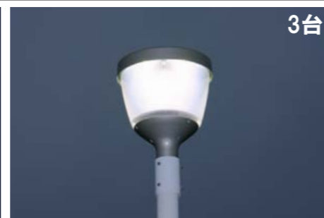
LED街路灯 水銀ランプ400形相当 DPE12H50S/NPT-8 定格消費電力:115W