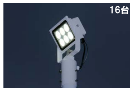
LED投光器 電源一体型 水銀ランプ400形相当 DTE13H21W/NPT-8 定格消費電力:96W