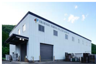
茨木塗料株式会社 姫路工場 兵庫県たつの市新宮町吉島853-34