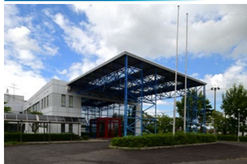
株式会社UACJ金属加工 郡山工場 福島県郡山市待池台1-22