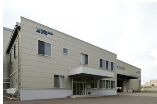
山崎金属産業株式会社 福井工場 福井県坂井市三国町テクノポート2-8-1