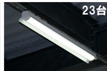
23台 LED一体型ベース照明 Nuシリーズ 40形 両反射笠形 ステンレス製防雨・防湿形 LAB4102/69N5-N8(特注品) 定格消費電力:41.8W