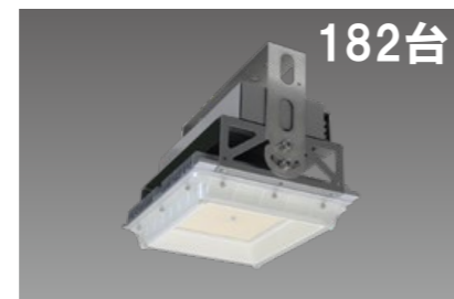
182台 高天井用LED照明器具 メタルハライドランプ400形相当 DRGE20H13S/N-PJX8 平均消費電力:105.0W