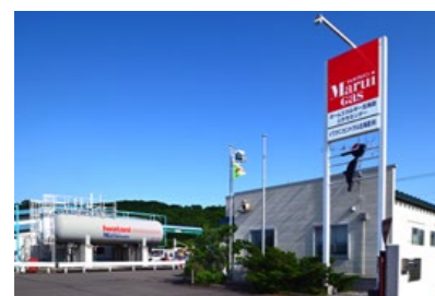
株式会社ホームエネルギー北海道 帯広センター 北海道中川郡幕別町札内みずほ町143-112