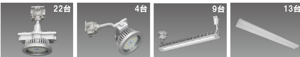
防爆形LED照明器具 高天井形 直付形 DRGE13H01(TB)S/N-PJ8 平均消費電力:92W