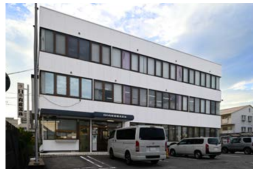
日の丸産業株式会社 広島県広島市南区上東雲町18-35