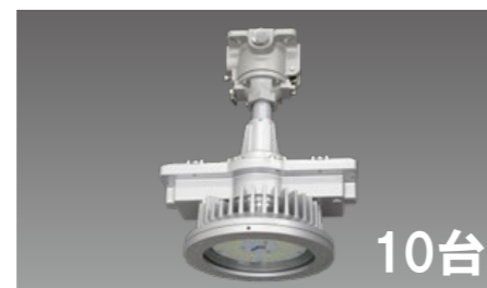
防爆形LED照明器具 高天井形 直付形 DRGE13H01(TB)S/N-PJ8 平均消費電力:92W