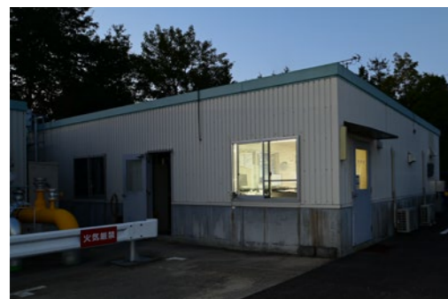
甲賀エナジー株式会社 滋賀県甲賀市水口町ひのきが丘12番地