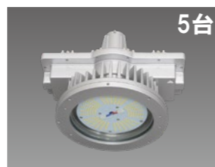
防爆形LED照明器具 高天井形 取替需要形 DRRE13H01(TB)S/N-PJ8 平均消費電力:92W