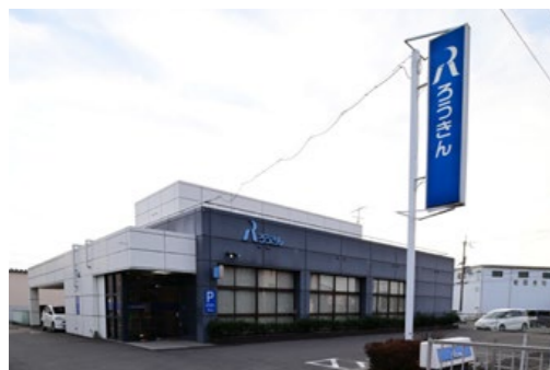
近畿労働金庫 水口支店 滋賀県甲賀市水口町東名坂277