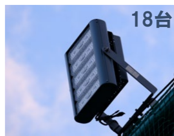
屋外用LED投光器 定格消費電力:250W