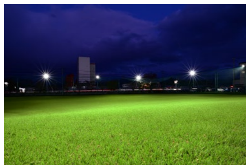
グラウンド 山形県